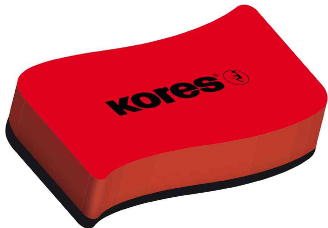
Tafellöcher / Whiteboard-Schwamm

- zur einfachen Trockenreinigung von Weißwandtafeln