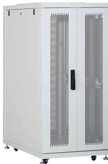
Perforierte zweiflügelige Stahl-Rücktür