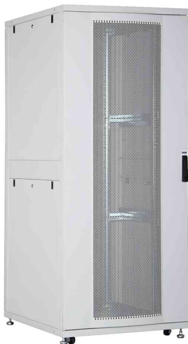
19" Serverschrank Unique Serie, lichtgrau