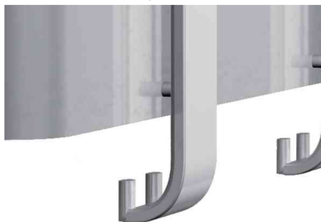
abgerundete, innenliegenden Hut- & Mantelhaken