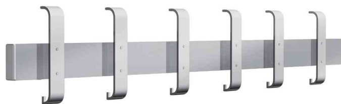
Sicherheits-Wandgarderobe Arosa, 12 Haken