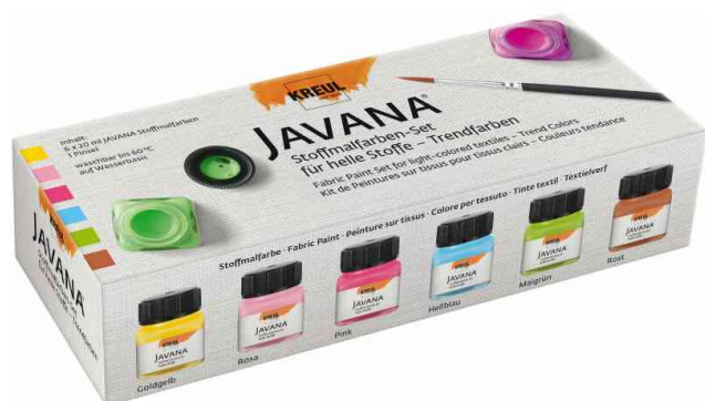
Textilfarbe JAVANA, Trendfarben-Set