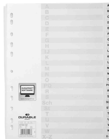
A-Z Kunststoff-Register, weiß, 24-teilig