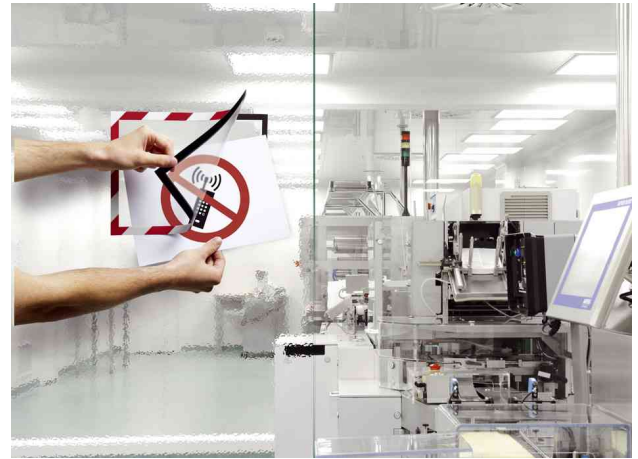
Farbe: rot/weiß - Anwendungsbeispiel