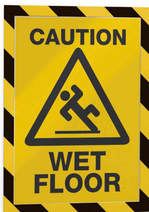
Farbe: gelb/schwarz - Anwendungsbeispiel