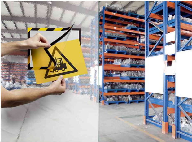
Farbe: gelb/schwarz - Anwendungsbeispiel