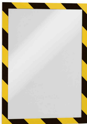
Magnetrahmen DURAFRAME SECURITY, gelb/schwarz