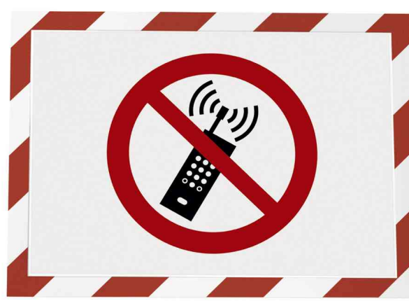
Farbe: rot/weiß - Anwendungsbeispiel