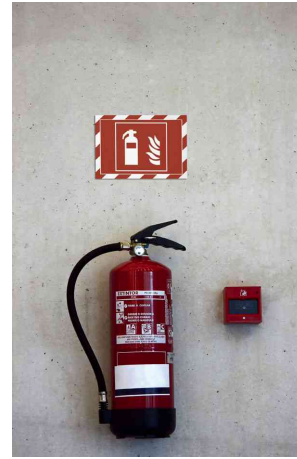
Farbe: rot/weiß - Anwendungsbeispiel