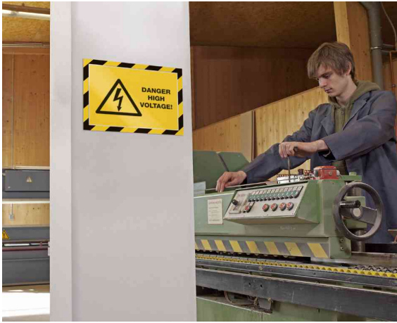
Farbe: gelb/schwarz - Anwendungsbeispiel