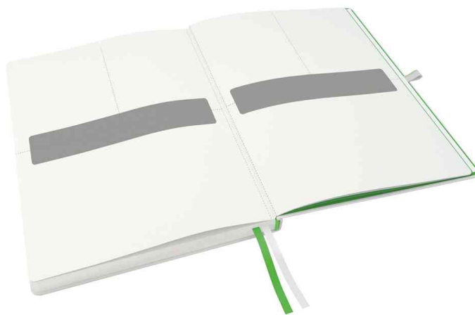
perforierte Blätter für Notizen