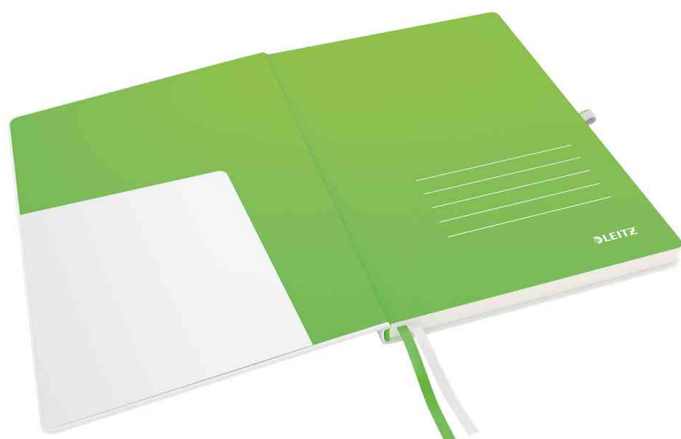
Innentasche im Vorderdeckel