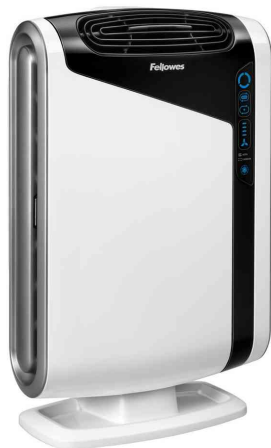
Luftreiniger AreaMax DX95