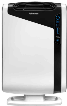
Luftreiniger AreaMax DX95