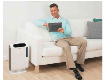
Luftreiniger AreaMax DX95, Anwendung