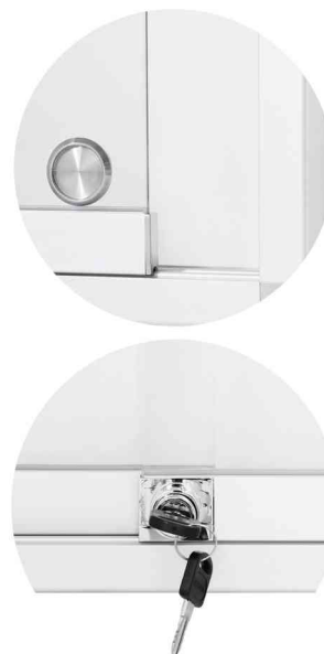
Detailansicht: Griffstück - Sicherheitsschloss