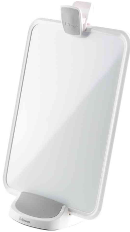
Konzepthalter I-Spire weiß/grau, im Hochformat

passend zu allen weiteren Produkten der Fellowes I-Spire Serie