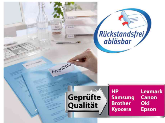
Etiketten, wiederablösbar, Anwendung