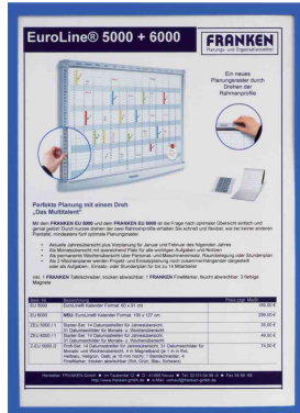
Magnet-Tasche FRAME IT X-tra!Line, blau