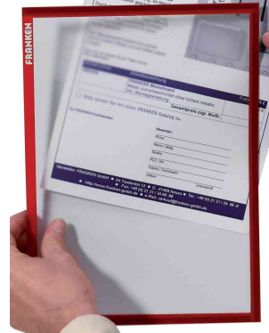
Magnet-Tasche FRAME IT X-tra!Line, rot