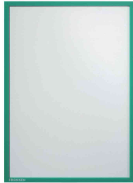
Magnet-Tasche FRAME IT X-tra!Line, grün