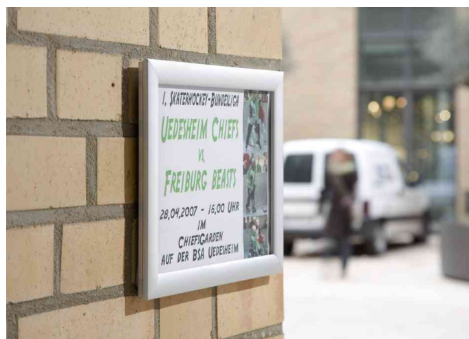
Plakaträhmen "Outdoor", Anwendung