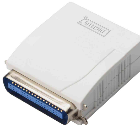
Fast Ethernet Printserver