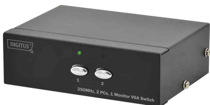
VGA Switch, 250 MHz, 2-fach