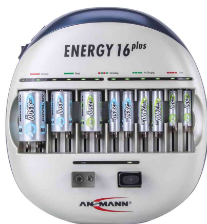
Ladestation "Energy 16 plus"