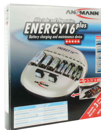
Ladestation "Energy 16 plus" - in Umverpackung