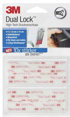
Dual Lock Klett-Power SJ3560