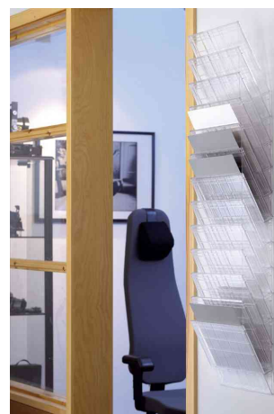
Wand-Prospekthalter "FLEXIBOXX 12", transparent - Anwendung