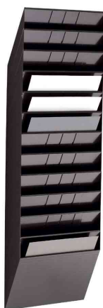
Wand-Prospekthalter "FLEXIBOXX 12", schwarz