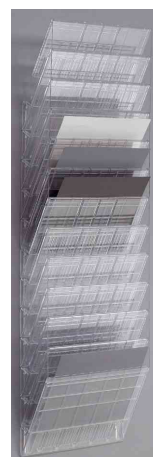
Wand-Prospekthalter "FLEXIBOXX 12", transparent