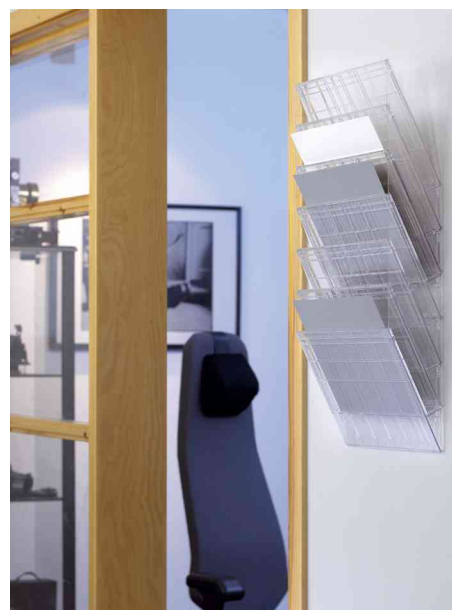
Wand-Prospekthalter-Set "FLEXIBOXX 6", transparent - Anwendung