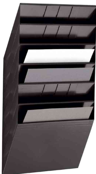
Wand-Prospekthalter-Set "FLEXIBOXX 6", schwarz