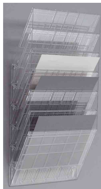
Wand-Prospekthalter-Set "FLEXIBOXX 6", transparent