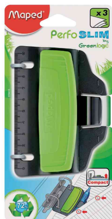
Taschenlocher Greenlogic, auf Blisterkarte