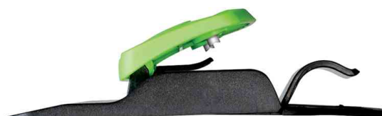
Taschenlocher Greenlogic, Seitenansicht