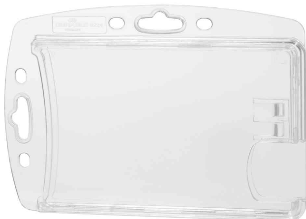
Namensschilder Doppelbox, Daumenstanzung