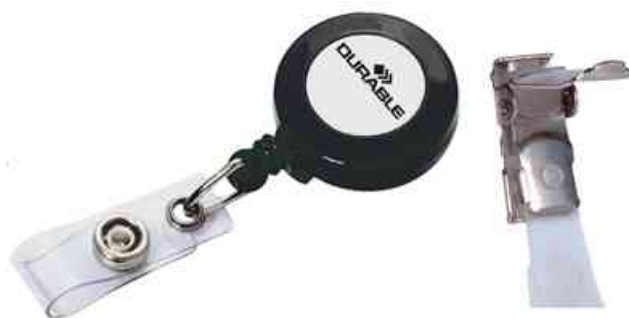
Zubehör: Ausweishalter - Ersatz-Clip