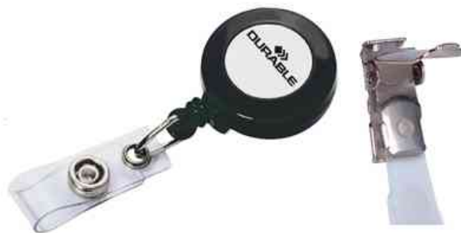
Zubehör: Ausweishalter - Ersatz-Clip