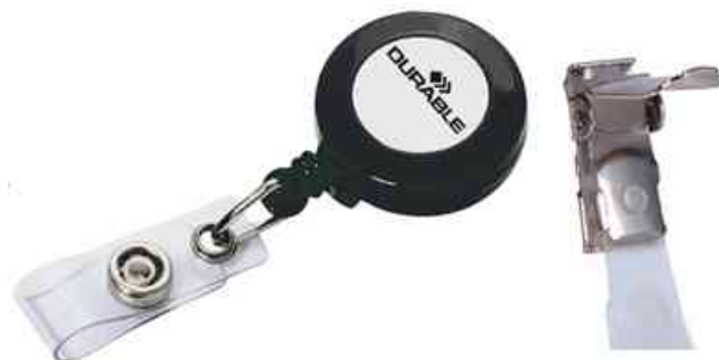
Zubehör: Ausweishalter - Ersatz-Clip