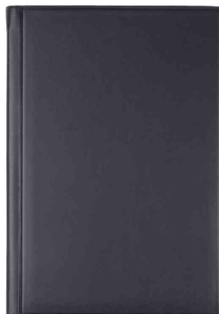
Buchkalender "Ultraplan", schwarz