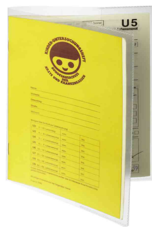
(3) Ausweishülle, DIN A5