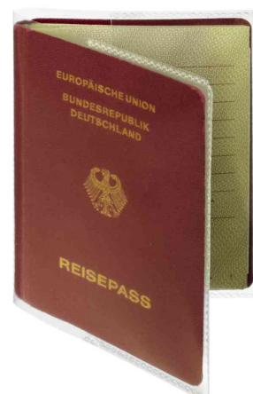
(1) Anwendungsbeispiel, 176 x 125 mm