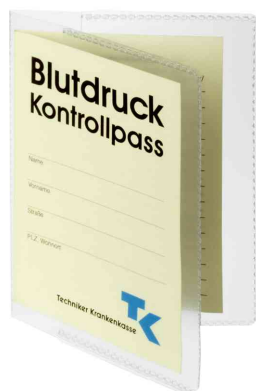
(2) Ausweishülle, DIN A7