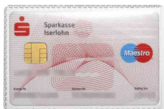
(1) Ausweishülle, 54 x 86 mm