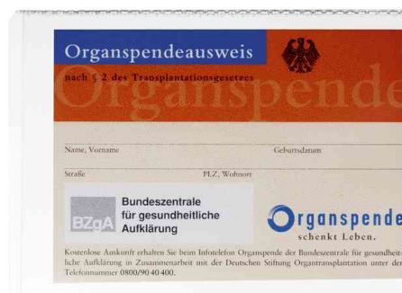
(4) Ausweishülle, DIN A7