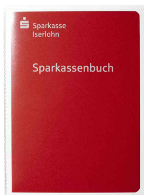
(5) Ausweishülle, DIN A6