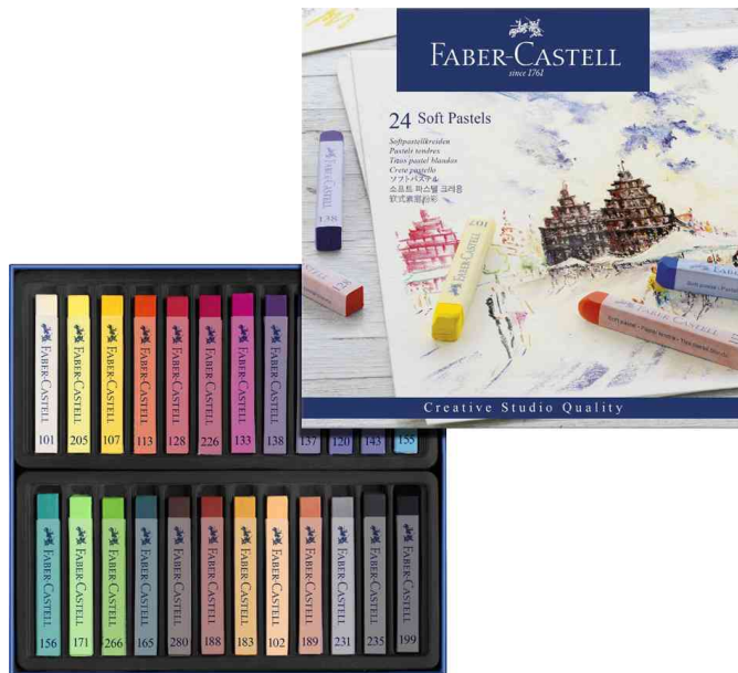
Softpastellkreiden STUDIO QUALITY, 24er Etui