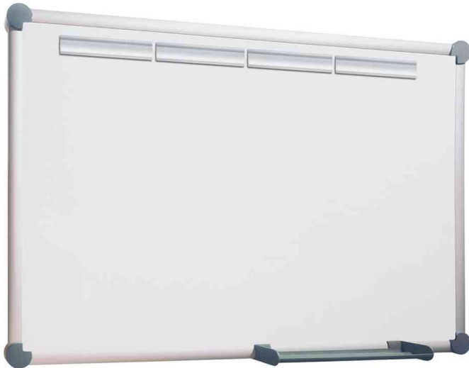
Weißwandtafel 2000 MAULpro Komplett-Set

Mehr Vielfalt: Viele Größen auch mit Kork-, Struktur- und Textil-Oberfläche erhältlich