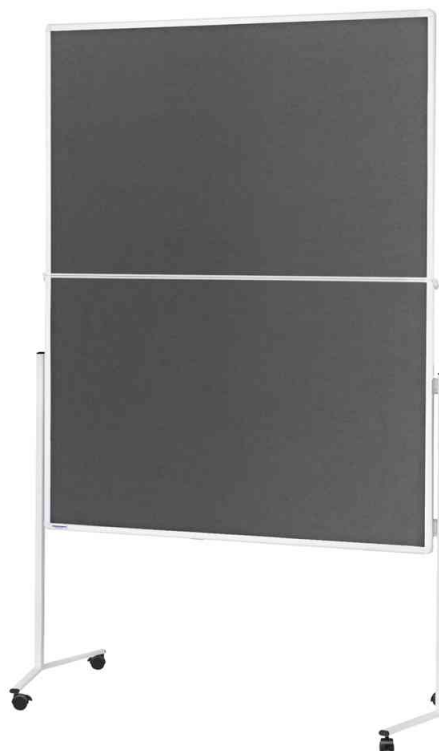
Moderationstafel mit weißem Rahmen, zweiteilig - Filz grau