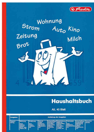
Formularbuch - Haushaltsbuch