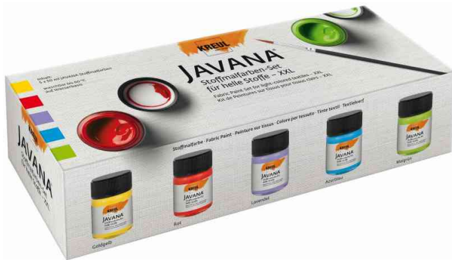
Textilfarbe JAVANA, XXL-Set