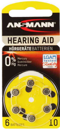
Hörgeräte Knopfzelle, Typ 10