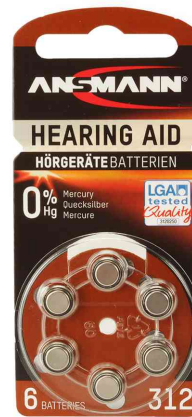
Hörgeräte Knopfzelle, Typ 312