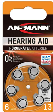
Hörgeräte Knopfzelle, Typ 13