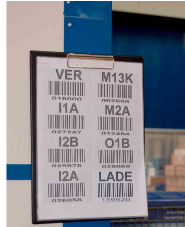
Klemmbrett mit Folienüberzug und 2 Neodym-Magnete, Anwendungsbeispiele