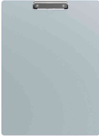
Klemmbrett, Aluminium mit Bügelklemme - DIN A3 hoch

DIN A3 quer: Klemmer an der langen Seite • Maße: (B)450 x (T)327 x (H)15 mm