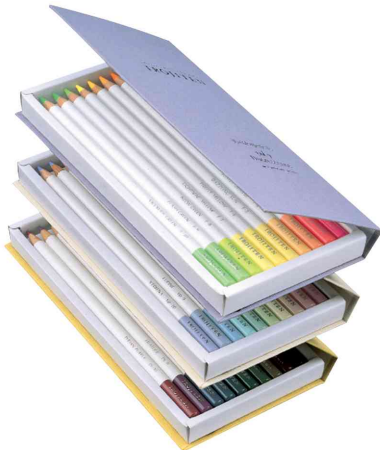
Buntstifte "IROJITEN" Seascap - offen