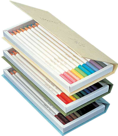
Buntstifte "IROJITEN" Rainforest - offen