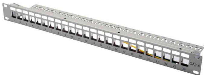
19" Modular Patch Panel, lichtgrau

Hinweis: Passende Keystone Module unter Bestell-Nr. 11005790