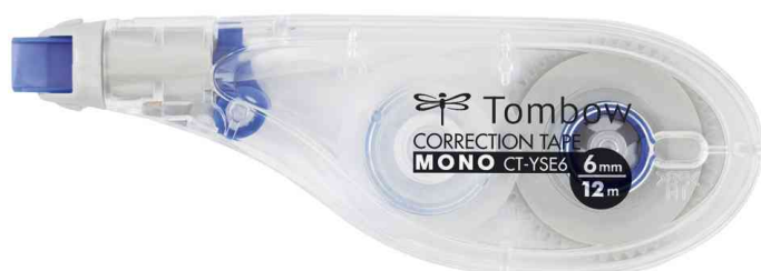
Korrekturroller "MONO CT-YSE6", 6,0 mm x 12 m