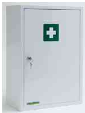
Verbandschrank Medisan B