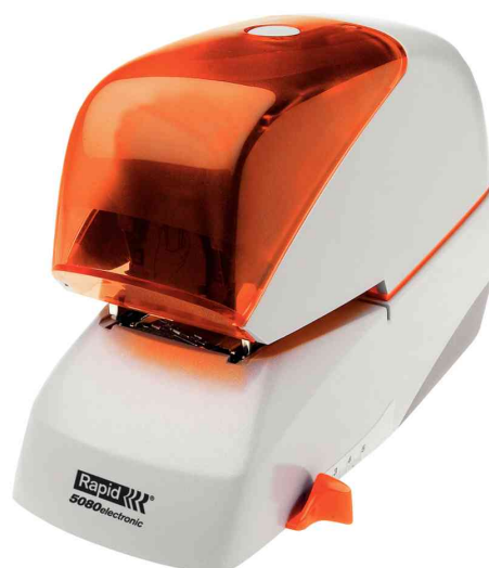
Elektro-Heftgerät Supreme 5080e, silber / orange