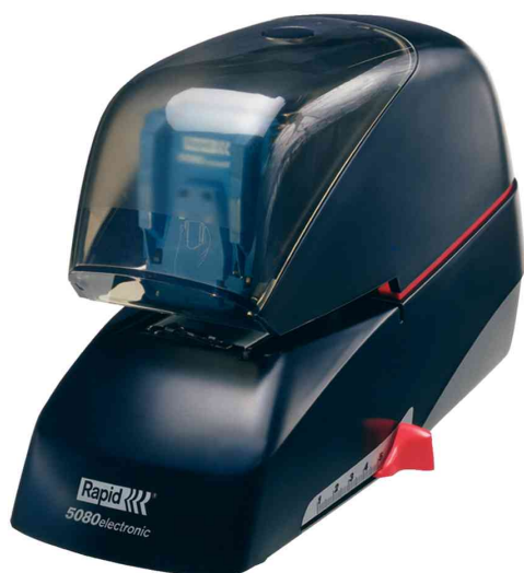
Elektro-Heftgerät Supreme 5080e, schwarz