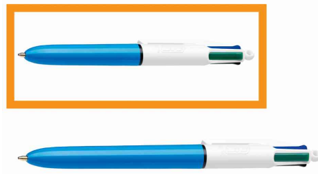
Vergleich: 4 Colours Mini - 4 Colours