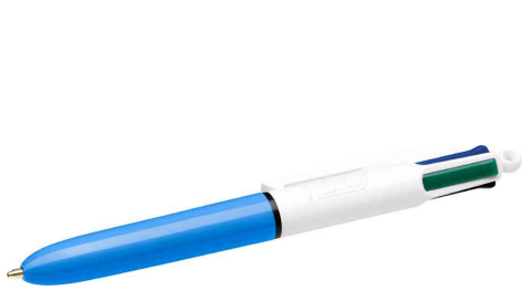
Druckkugelschreiber 4Colours Mini