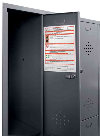
Anwendungsbeispiel: Befestigung von Sicherheitshinweisen