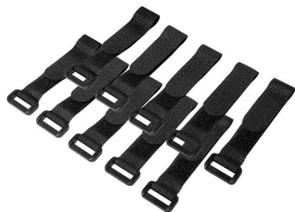
Klett-Kabelbinder, 150 x 20 mm