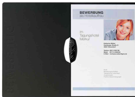
Bewerbungsmappe "Swing", schwarz