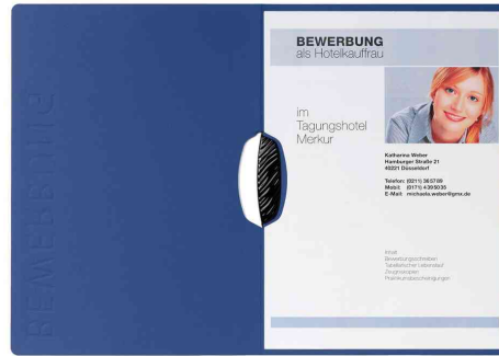
Bewerbungsmappe "Swing", blau