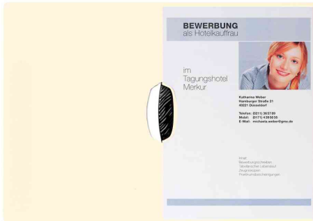
Bewerbungsmappe "Swing", beige