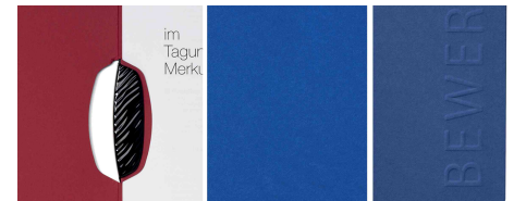
Kunststoffklemme - Satinierter Karton - Prägung