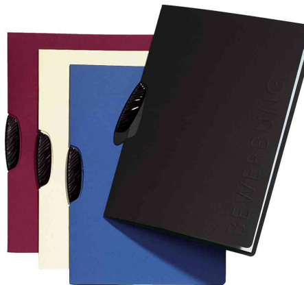
Bewerbungsmappe "Swing", geschlossen