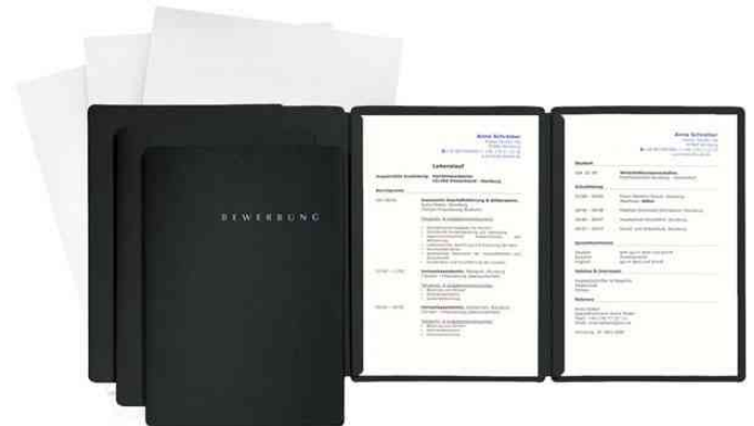
Bewerbungs-Set "Special", schwarz