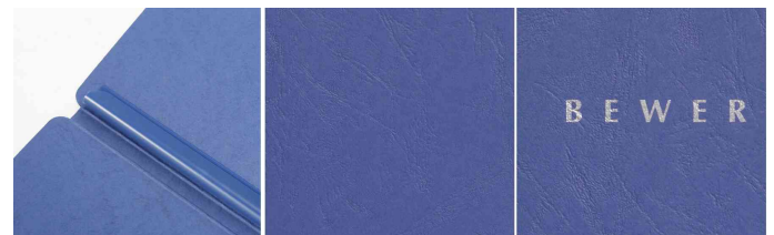
Klemmschiene - Hochwertiger Karton - Schriftzug