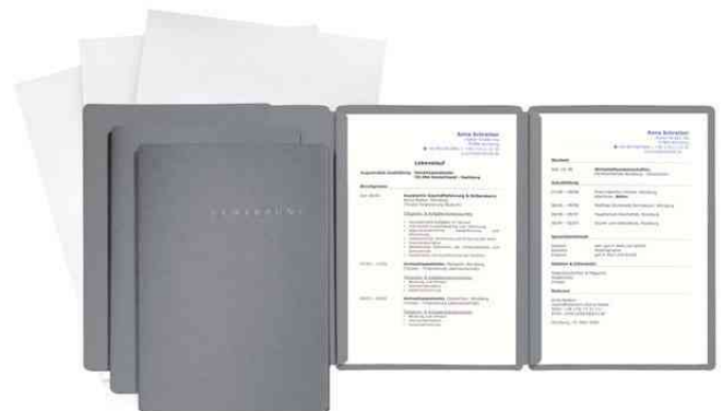
Bewerbungs-Set "Special", grau