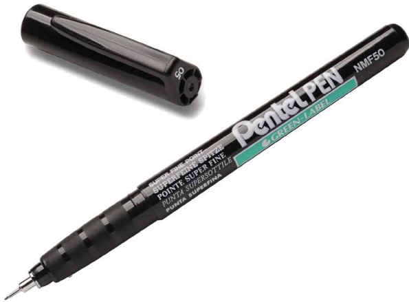
Permanent-Marker GREEN-LABEL NMF50