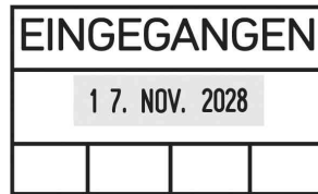
Abdruckbeispiel, Eingegangen + 4 Felder