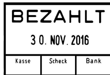
Abdruckbeispiel, Bezahlt + Kasse, Scheck, Bank