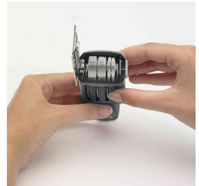
3. Datum einstellen