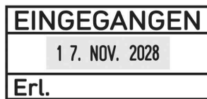
Abdruckbeispiel, Eingegangen + 1 Feld