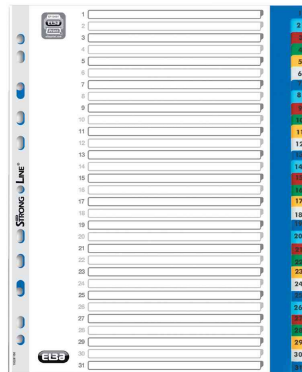
Zahlen Kunststoff-Register, 31-teilig, A4+