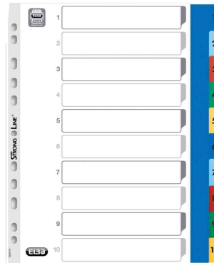
Zahlen Kunststoff-Register, 10-teilig, A4+