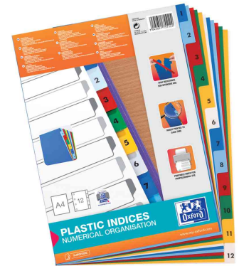
Zahlen Kunststoff-Register, 12-teilig