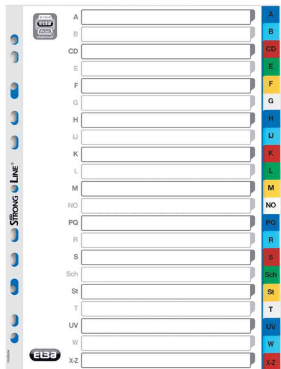
Buchstaben Kunststoff-Register, 21-teilig