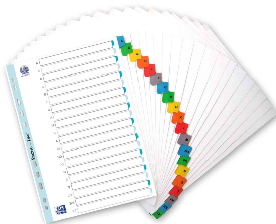
A-Z Mylarkarton-Register, farbige Taben - 20-teilig