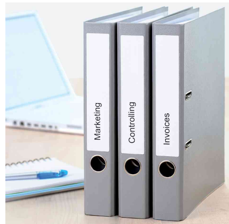
Orderrücken-Etiketten SPECIAL, Anwendung